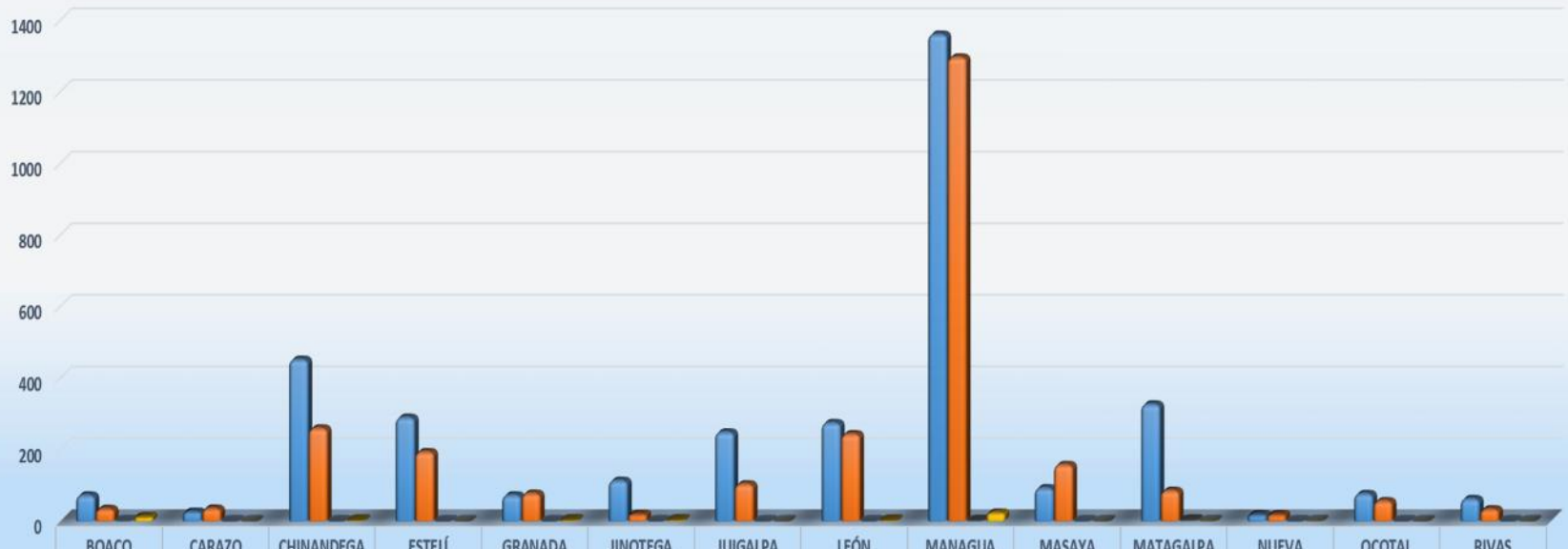
MINISTERIO DE TRANSPORTE E INFRAESTRUCTURA UNIDAD DE GESTION AMBIENTAL OFICINA DE CONTROL DE EMISIONES VEHICULARES MEDICIONES APROBADAS Y RECHAZADAS POR DEPARTAMENTO MES DE JULIO 2018